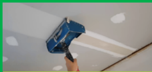
РЪЧНО ИЛИ МАШИННО