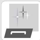
ФИНО И ГЛАДНО ПОКРИТИЕ