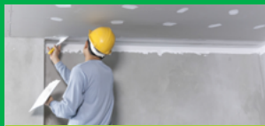
ЗА СТЕНИ И ТАВАНИ