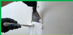
ЗА ЗАПЪЛВАНЕ НА ФУГИ