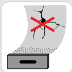
УСТОЙЧИВА НА НАПУКВАНЕ И ЛЕСНА ЗА ШЛАЙФАНЕ