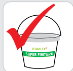
ГОТОВА ЗА УПОТРЕБА