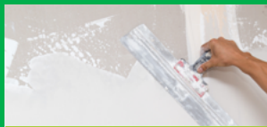
ЗА ЦЯЛОСТНО ШПАКЛОВАНЕ